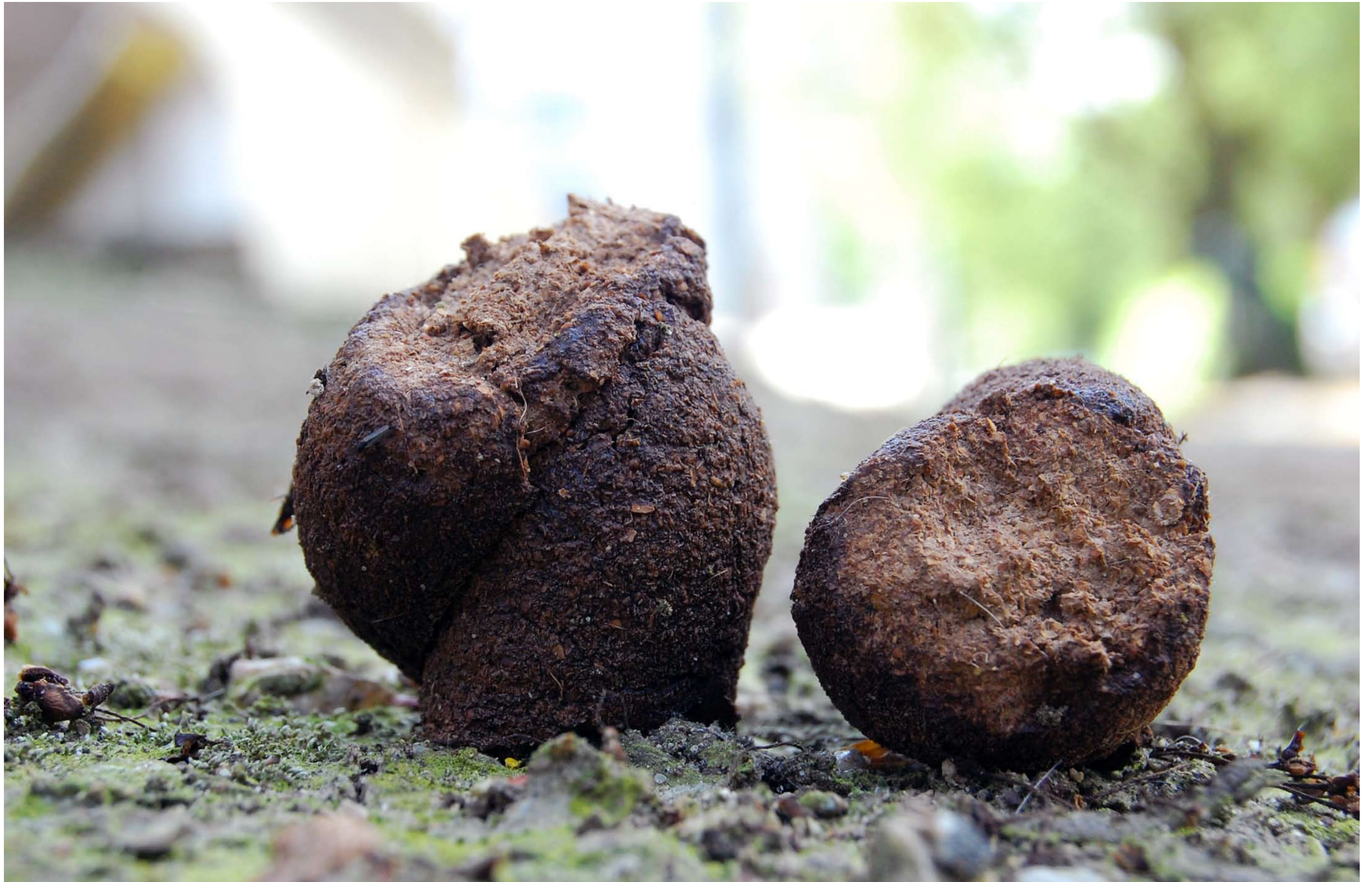
Cloaca Faeces II (2009) mixed media & digestive tract ingredients