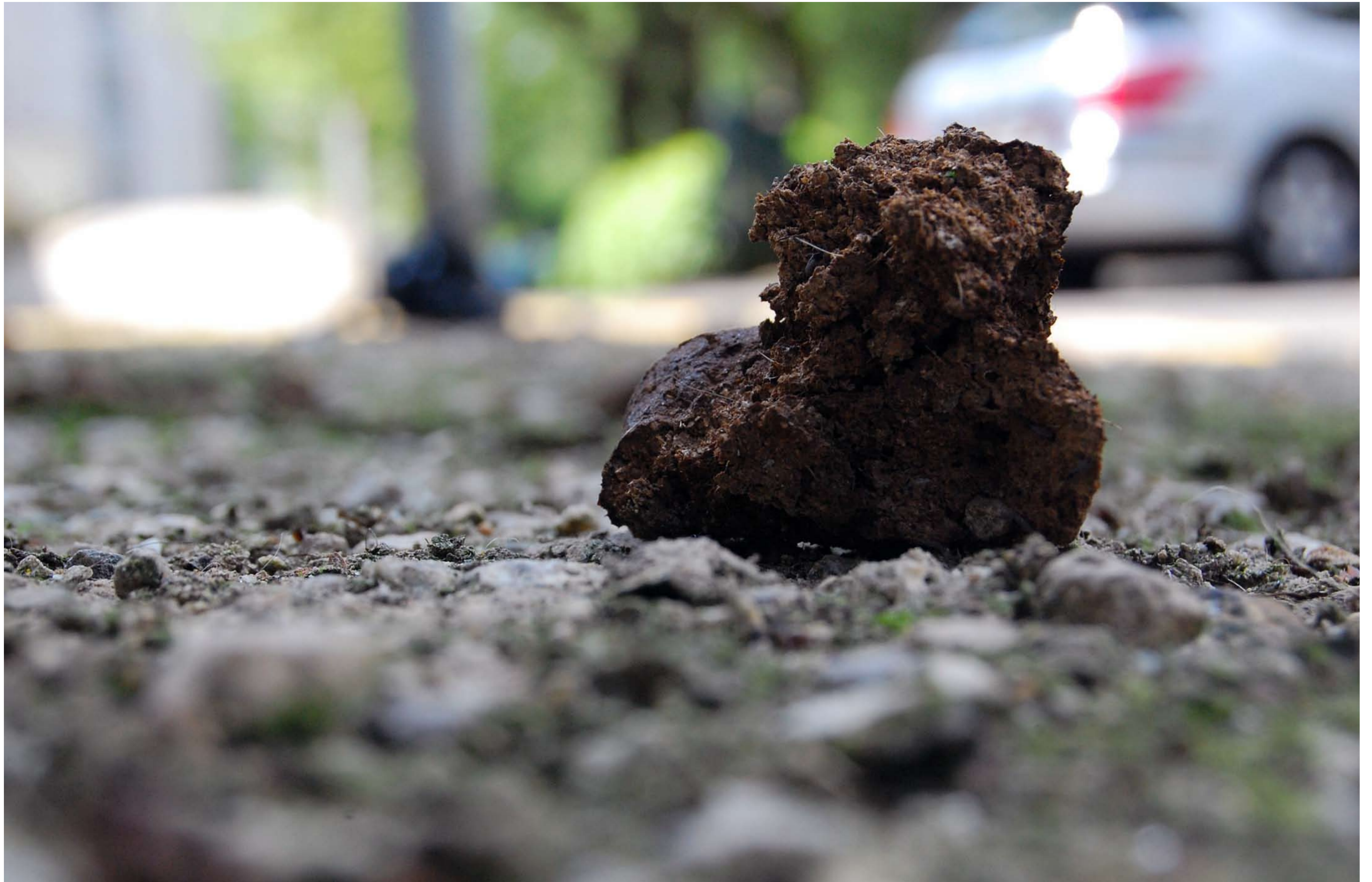
Cloaca Faeces VI (2009) mixed media & digestive tract ingredients, courtesy of the artist (unknown)