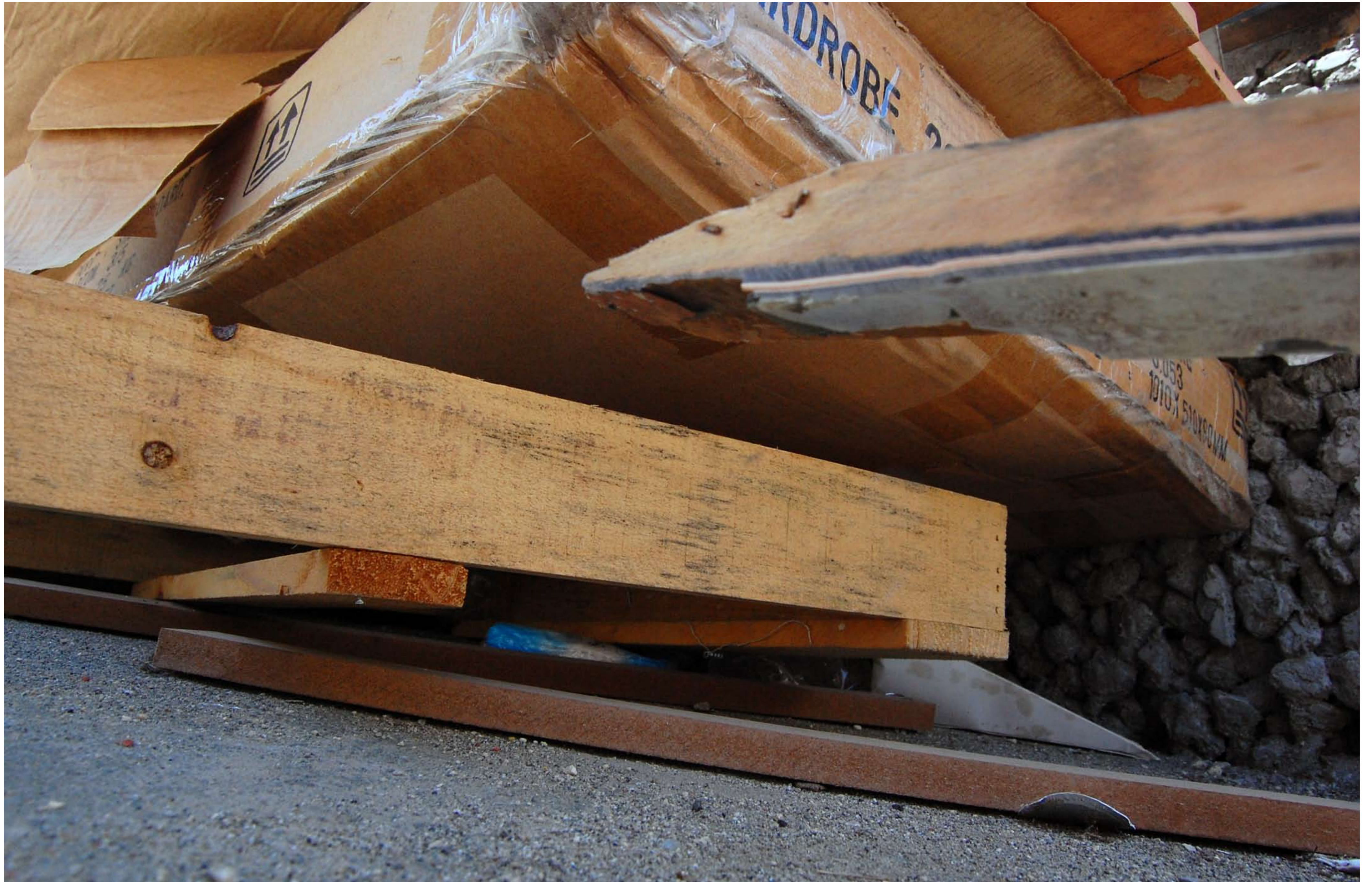
Construction Waste (2009) wood, courtesy of the artist (unknown)